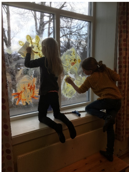
Flere unger hjalp til med å vaske bort solene, og gi plass for 17.maipynt.