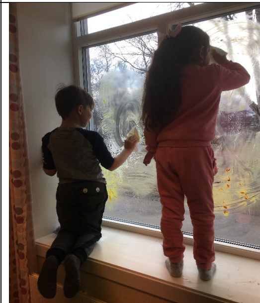
Ungene syntes det var kjempeartig å vaske!