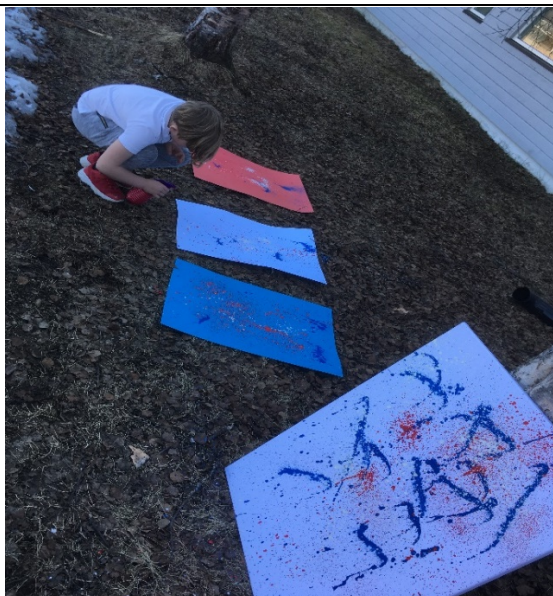
Her sprayes med rødt, hvitt og blått!

Vi har hatt bilder hengende på kommunehuset for å pynte opp litt der. I mai byttes disse ut med andre bilder fra oss. Ta gjerne en titt på de når dere er innom der. 3 bilder henger også ved legekantoret.