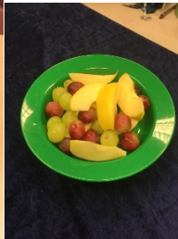
Det ble servert