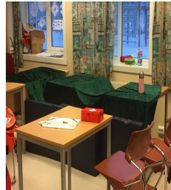
En stall- og så ble det skole:o)